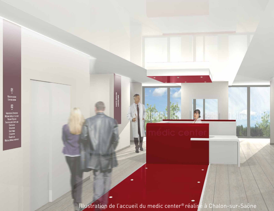
Illustration de l'accueil du medic center® réalisé à Chalon-sur-Saône

2 300 m 2 divisibles, d'activités médicales, paramédicales et tertiaires santé, à l'acquisition, et à la location.